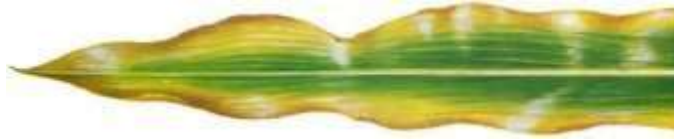
Figuur 5. Kaliumgebrek in maïs.

Kalium is nodig voor de opbouw van het assimilatie-apparaat maar ten opzichte van andere gewassen is maïs weinig kaliumbehoefstig. Een gebrek aan kalium is vooral zichtbaar in periodes met snelle groei (juni/juli). Het veroorzaakt geelverkleuring van de bladranden, gevolgd door verdorring. De onderste bladeren vertonen als eerste tekenen van een gebrek waarna de verschijnselen geleidelijk overgaan naar de hogere bladeren. (Van Wijk et al., 1993)