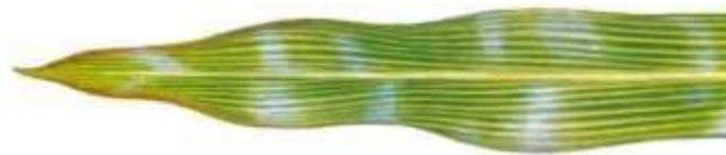
Figuur 6. Magnesiumgebrek in maïs.

Gebreksverschijnselen tonen een gebrek voor het gewas maar het duidt niet altijd op een magnesium tekort in de bodem. Het kali-magnesiumantagonisme kan bij zware kaliumgiften zorgen dat er een gebrek magnesium tot uiting komt. Ook een lage bodempH verhoogt de kans op magnesiumgebrek. In dat geval is het gebruik van magnesiumhoudende kalk aanbevolen. In de andere gevallen geeft men best 300 kg magnesiumsulfaat (kieseriet) per hectare. Indien er gebreksverschijnselen tot uiting komen is een bladbespuiting met magnesiumsulfaat (bitterzout) meestal voldoende. (Van Wijk et al., 1993)