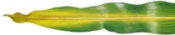
Figuur 3. Stikstofgebrek in maïs.

Blok et al. (2023) stelt dat de stikstofbemesting voor suikermaïs 180 kg N/ha bedraagt maar specifieke stikstofbemestingsadviezen voor suikermaïs bestaan er tot op vandaag niet. Als referentie hanteert men daarom de adviezen die gelden voor korrelmaïs. Deze adviezen houden geen rekening met de wettelijke normen en dienen dus bedrijfsspecifiek bekeken te worden.