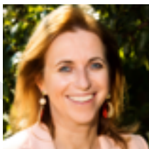
Inge Moors gedeputeerde van Landbouw en Platteland

Om innovaties in de land- en tuinbouwsector te waarderen, organiseert de Provincie Limburg de Innovatie-Award voor Land- en Tuinbouw. We willen namelijk de Limburgse land- en tuinbouwer verder stimuleren om creatieve ideeën in de praktijk om te zetten. Bent u één van deze ondernemende landbouwers die misschien al jaren met een concept of een idee zit maar bent u nog niet toegekomen aan de uitvoering ervan? Dan willen we u graag uitnodigen om uw project in te dienen en kans te maken op één van de vijf geldprijzen ter waarde van 5000 euro om uw project te realiseren.